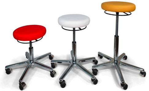
411-02K, 411-02, 411-02L; jeweils in mittlerer Höhe